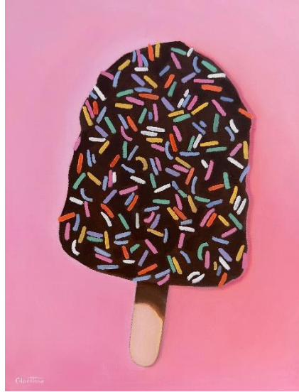
I'll Have Sprinkles , Joan Gladstone, Giclee Print, 202

Những tranh vẽ đầy năng động và siêu thực tế của Jeffries Moore tìm cách thu tóm biển ở mức độ mạnh bạo nhất, nhấn mạnh đến cả hai cái đẹp và sự nguy hiểm của nước. Bức tranh ở độ lớn mang tên Hand of God chắc chắn là trụ điểm chú ý của cuộc triển lãm.